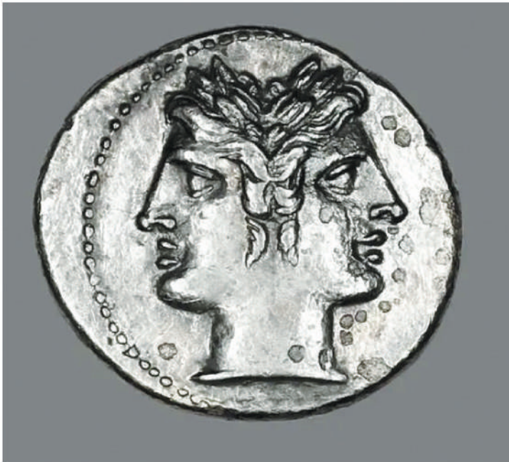
(dieu à 2 faces dont l'une regarde vers l'arrière et l'autre vers l'avant, symbole de la fin et du renouveau) - notre mois de janvier.

Pourquoi le 1er janvier est-il le « jour de l'An » ? Depuis quand ?